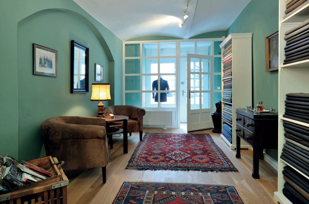
MASSALON POSSANNER IM HERZEN VON DÖBLING